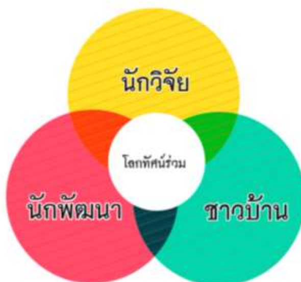
แผนภาพ โลกทัศน์ร่วม การมีส่วนร่วม

และในปีงบประมาณ 2562 ได้ศึกษากระบวนการแสวงหาความรู้ใหม่ ผ่านกระบวนการปฏิบัติร่วมกันของชุมชนท้องถิ่นที่ก่อให้เกิดการเปลี่ยนแปลง/การพัฒนา เป็นงานของคนท้องถิ่น เพื่อคนท้องถิ่น เน้นการมาร่วมทำวิจัยของชาวบ้าน เจ้าของปัญหาเป็นผู้ปฏิบัติการลงมือทำวิจัยเอง เพื่อแก้ไขปัญหา นั่นคือ การการวิจัยเพื่อท้องถิ่น (CBR : Community Based Research)