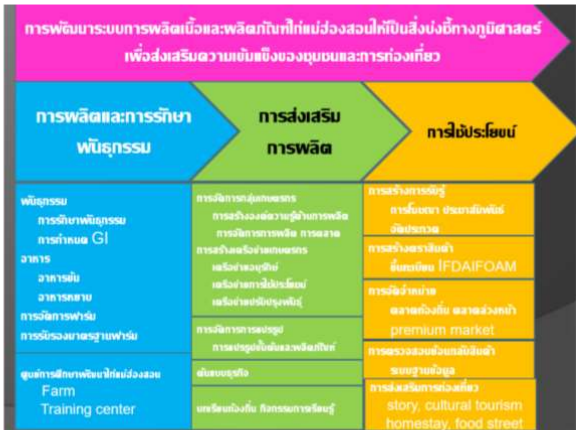
แผนการพัฒนากระบวนการผลิตเนื้อและผลิตภัณฑ์ไก่แม่ฮ่องสอนให้เป็นสิ่งบ่งชี้ทางภูมิศาสตร์ เพื่อส่งเสริมความเข้มแข็งของชุมชนและการท่องเที่ยว